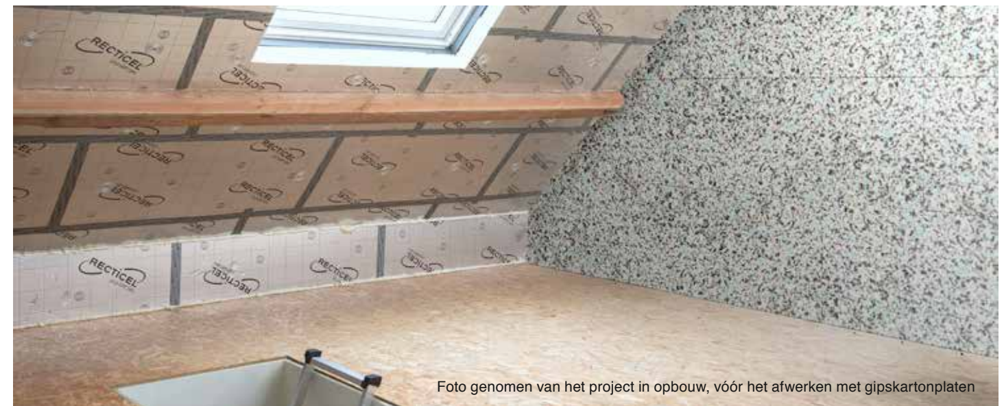
Foto genomen van het project in opbouw, vóór het afwerken met gipskartonplaten

Eigenaar en bewoner Wouter De Vos wilde zijn niet-geïsoleerde zolder omtoveren tot comfortabele woonruimtes: een slaapkamer, dressing en open ruimte voor polyvalent gebruik. Hij koos voor Fitforall isolatieplaten en de akoestische muurisolatie Simfofit ® .