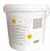
Lijm voor akoestische panelen